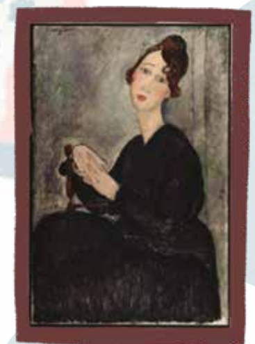
Amedeo Modigliani, Portrait of Déda , 1918

Buongiorno ! Mon nom est Amedeo Modigliani. Je suis surtout pour mes peintures et mes sculptures qui ressemblent à des masques primitifs. J'aime utiliser des lignes faciales simples, avec des yeux en amande ainsi que des cous et des visages étirés.