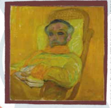
František Kupka, The Yellow Scale , 1907 (C) Centre Pompidou, MNAM-CCI, Dist. RMN-Grand Palais / Jean-Claude Planchet (C) ADAGP, Paris, 2019

Salut ! Mon nom est František Kupka . Je suis connu pour mon utilisation des couleurs. Elles expriment mes émotions plutôt que de montrer les choses telles qu'elles sont dans la réalité. N'est-ce pas délirant et amusant ?