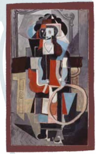
Pablo Picasso, Young girl with a hoop , 1919 (C) Philippe Migaut - Centre Pompidou, MNAM-CCI / Dist. RMN-GP © Succession Picasso 2019

Te voilà ! Je suis Pablo Picasso. J'ai toujours voulu peindre différemment, alors je me suis appris moi-même à peindre en utilisant mon imaginations, comme un enfant. Mes toiles ont souvent l'air d'avoir été brisées en de petites formes géométriques.