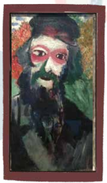
Marc Chagall, The Father , 1911

Je considère ceci comme une toile très personnelle.